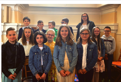
Die fleißigen SängerInnen der 3. und 4. Klasse der Volksschule bei der Erstkommunion in Würmla

Die Erstkommunionsfeier in Würmla findet am 7. Mai statt und in Kapelln am 18. Mai. Die Kinder der Volksschulen werden dabei von den VS-Lehrerinnen und MS-Lehrerinnen Eva Kerner und Petra Kovacic betreut. Bei der Muttertagsfeier am 5. Mai in Perschling spielen die Bläserklassen der VS Perschling unter der Leitung von Mirjam Schiestl auf.