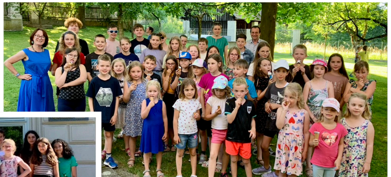
Dreimal Zeugnisverteilung: oben in Kapelln, links in Würmla und unten in Perschling.

Nach der Zeugnisverteilung am letzten Donnerstag des Schuljahres, die immer mit der offiziellen Übergabe der Zeugnisse und einer kleinen Belohnung in Form eines Eises von statten